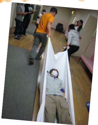
シートを使用しての避難誘導法