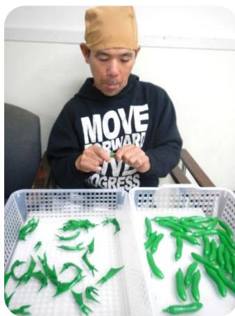
疑念をかけられている！？N氏

新谷製作所様より頂いているバリ取りの作業、特に頑張っている3人なので！？撮らせて頂きました。決してヤラセではありません。これからも頑張りましょう！(藤木)