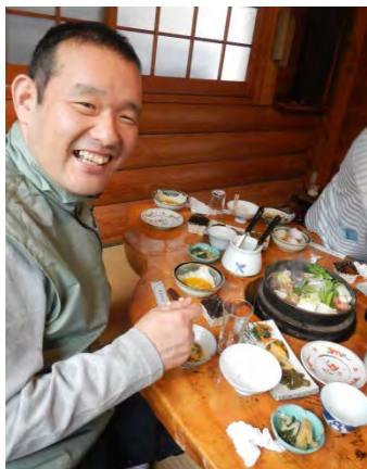
ここで飼っている地鶏らしい

2日目はのどかな北部の風景を離れ、京都市内へ。初日とは打って変わって、良く晴れた暑い日でした。京都の町並みと少し色づいた木々を眺めながら動物園に行き、最後はかの有名な「辻利」の抹茶スイーツで旅を締めくくりました。近いけどあまり知らない京都を南北に縦断し、笑いあり、ハプニングありの濃い2日間となりました。(鈴木)