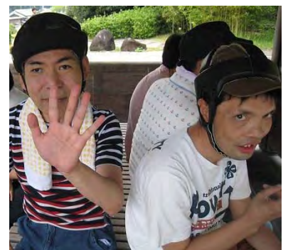
高山竹林公園にて