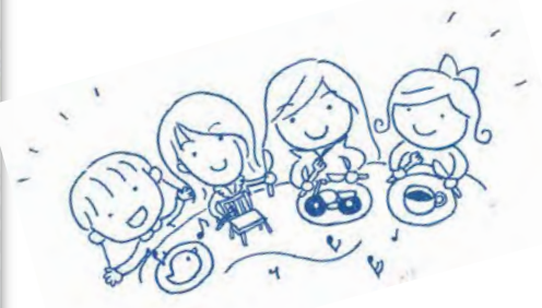
恒例のみんなで記念撮影会！