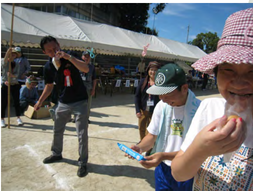
市長とのパン食い競争!