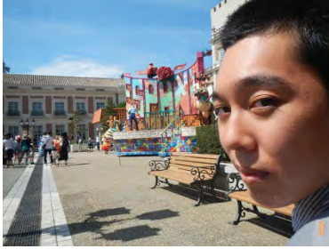
リズムに乗り興味津々なKさん