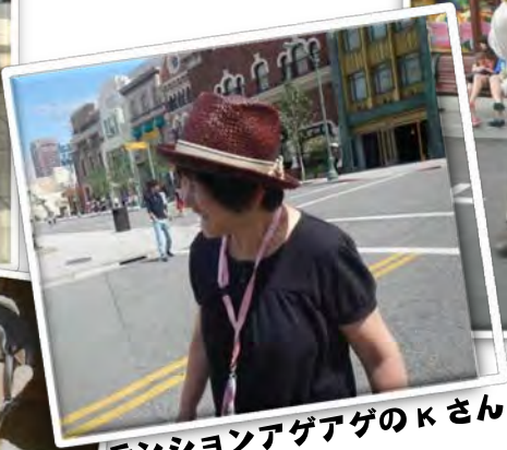
テンションアゲアゲの K さん♂