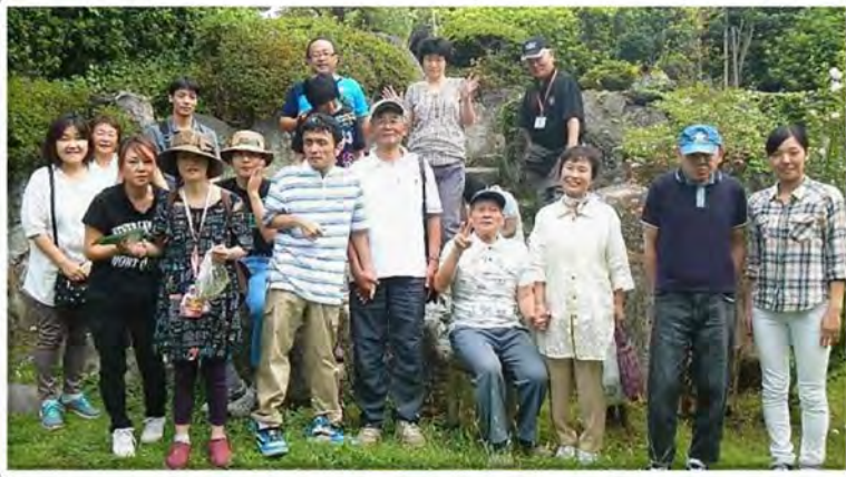
天平倶楽部の庭園にて撮影しました！