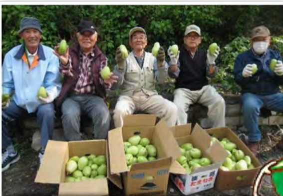
いつもご協力ありがとうございます!!

丁度収穫祭の時に立ち会えて良かったです。漬物にしたり、煮たりして食べたら美味しいとの事です。皆さんも一度食べてみてください。(上森)